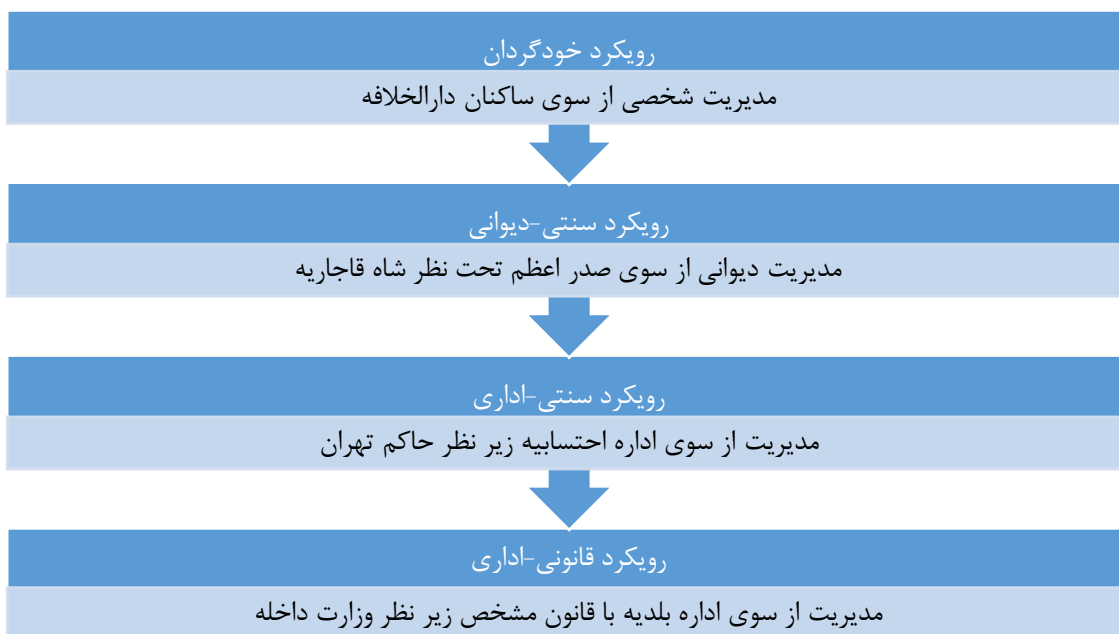
Fig. 2- Conceptual model of the process of administrative and structural changes in Tehran urban water management in the Qajar period (drawn by the authors)

شکل ۲- مدل مفهومی فرایند تحولات اداری و ساختاری مدیریت آب شهری تهران در دوره قاجاریه (ترسیم از سوی نگارندگان)