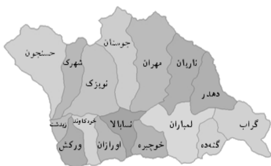
شکل ۱- موقعیت زیرحوزه های آبخیز طالقان رود

محدوده مورد مطالعه حوزه آبخیز طالقان تا محل ایستگاه هیدرومتری گلینک در خروجی حوزه با مختصات جغرافیایی بین ۲۰' ۵' ۳۶" و ۱۵' ۱۱' ۳۶" عرض شمالی و ۰۰' ۴۵' ۵۰" و ۲۲' ۱۱' ۵۱" طول شرقی می باشد که بخشی از سرشاخه های حوزه آبخیز سفیدرود است. ارتفاع متوسط منطقه ۲۷۳۴ متر از سطح دریا می باشد. مساحت منطقه مورد مطالعه ۸۰۲ کیلومترمربع می باشد. ویژگی کلی توپوگرافی منطقه کوهستانی بودن آن است و متوسط بارندگی منطقه ۶۹۷ میلیمتر می باشد. شکل ۱ موقعیت منطقه مورد مطالعه را نشان می دهد.