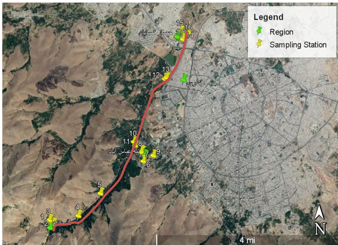
Fig. 1- Map of study stations and sampling points in Abbasabad River شکل ۱- نقشه ایستگاه‌های مطالعاتی و نقاط نمونه‌برداری در رودخانه عباس‌آباد همدان

همدان منطقه‌ای کوهستانی است و کوه الوند با ارتفاعی در حدود ۳ هزار و ۳۱۲ متر از مهم‌ترین ارتفاعات آن به حساب می‌آید. رودخانه عباس‌آباد به طول ۱۸ کیلومتر از دامنه‌های کوه فخرآباد در ۱۲ کیلومتری جنوب غربی همدان سرچشمه می‌گیرد و در جهت جنوبی شمالی ادامه مسیر می‌دهد و پس از آبیاری باغ‌های روستای عباس‌آباد